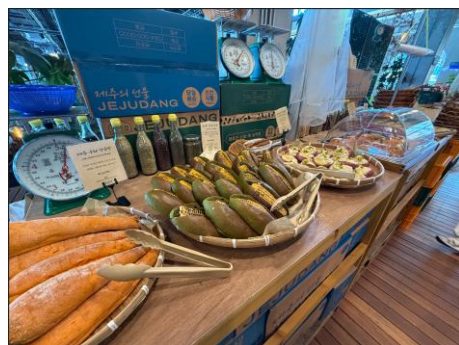
■おいしそうなパン。朝食にもおすすめ！