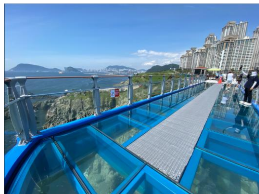
五六島スカイウォーク