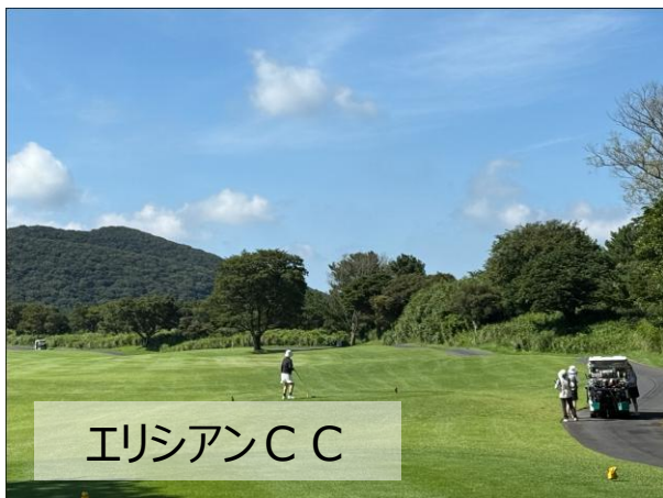
エリシアン C C

島内に30以上のコースがあり、ほとんどのコースで予約可です。ソウルや釜山より時間の融通がききやすく、ホテルから近いゴルフ場も多いです。