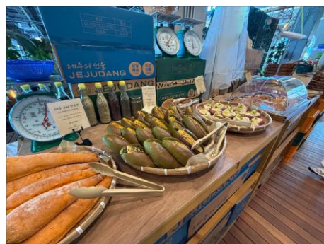
■おいしそうなパン。朝食にもおすすめ！