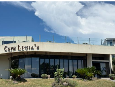
■海沿いのカフェもお勧めです。店内も良い雰囲気。海を眺めながらコーヒータイムを楽しめます。