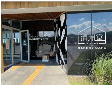
■人気店の一つ「濟州堂」

近年ブームになっています。濟州島の綺麗な風景を眺めながらコーヒー飲んだりパンを食べたりゆっくりした時間を過ごすのはいかがでしょうか？