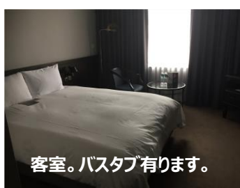
客室。バスタブ有ります。