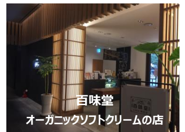
百味堂 オーガニックソフトクリームの店

済州で一番人気のゴルフ場、『オラカントリークラブ』もここメゾングラッドホテル系列です！！