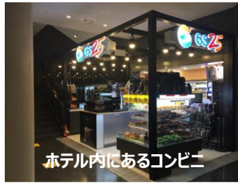
ホテル内にあるコンビニ