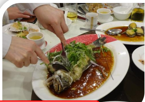
海鮮料理専門店でも舌鼓!