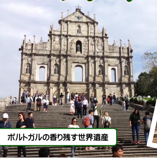
ポルトガルの香り残す世界遺産