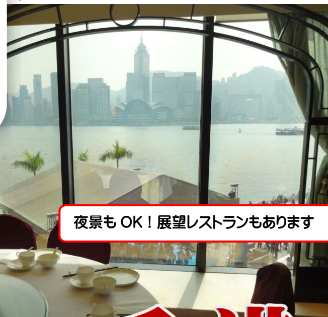
夜景もOK! 展望レストランもあります