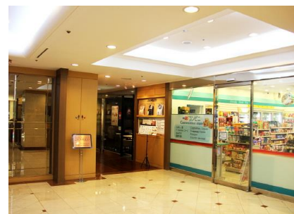
1階ロビーにコンビニ有ります。