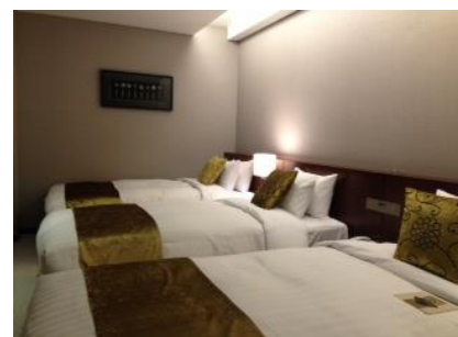
トリプル専用ルームがある数少ないホテルです。