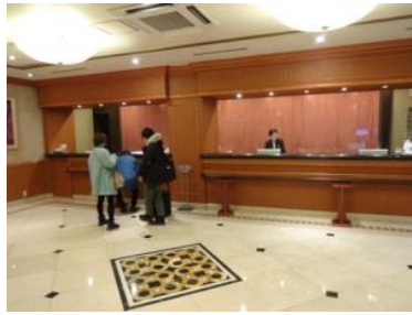
ロビーは2階になります。