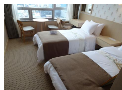
スタンダードツイン。