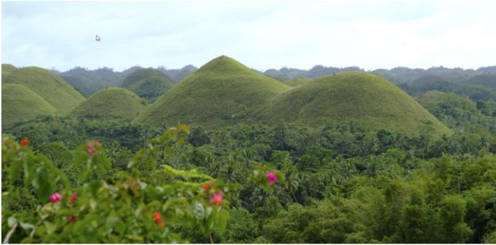
チョコレートヒルズ