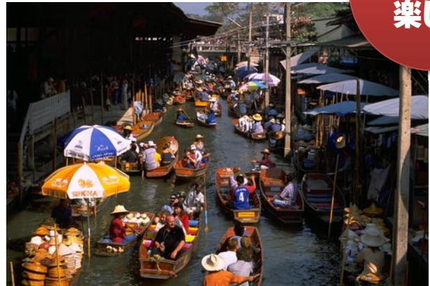
バンコク観光では定番の水上マーケット。鉄道市場もこの近くにあります。最もにぎわうのは朝7～9時頃です。