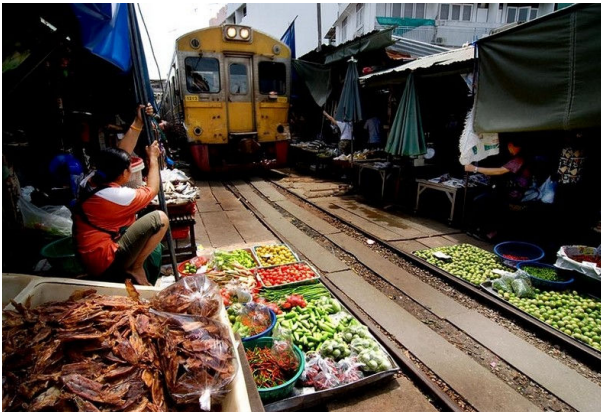
1日4往復、列車が来るたびに、畳んでは広げるメークロン市場。この列車にも乗って車窓からも楽しめます。 ※列車運休 2015年5月13日～11月08日(予定)