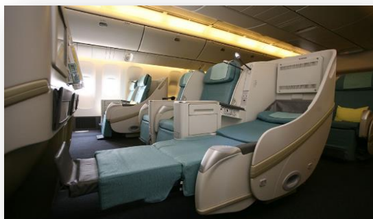
ビジネスクラスの座席のイメージ