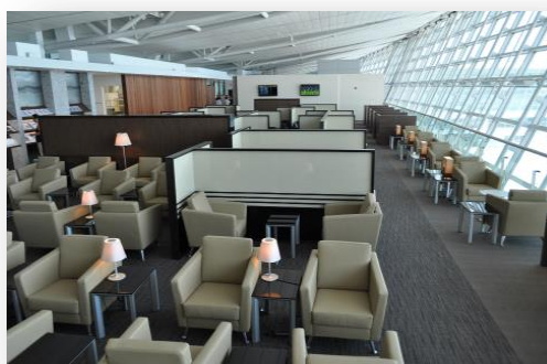
ラウンジ内のイメージ