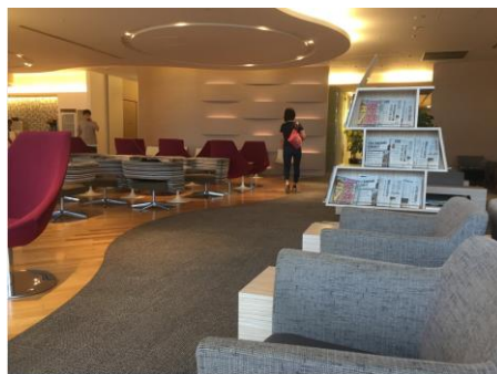
成田空港ラウンジ