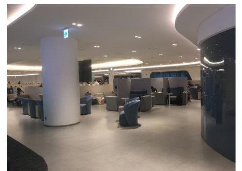
仁川空港ラウンジ